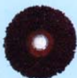
แปรงมะพร้าว