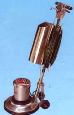
เครื่องขัดพื้น เหมาะสำหรับงานซีกพวม พร้อมแท่งค้ำน้ำหนัก STAINLESS ระบบ SPING VALVE ช่วยให้การทำงานสะดวกรวดเร็ว ขนาดเครื่อง 16" 1 HP