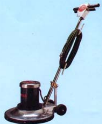
เครื่องขัดพื้น สำหรับงานขัดล้าง ทำความสะอาด และขัดเงาพื้นทั่วไป ขนาดเครื่อง 14" - 22"