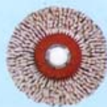
แปรงไนล่อน