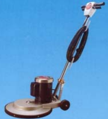
เครื่องขัดเงาพื้นหินอ่อน แกรนิต กระเบื้องยาง และงานขัดเงาทั่วไป ขนาดเครื่อง 18" ความเร็ว 350-500 RPM