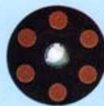
จานจับแผ่นโย